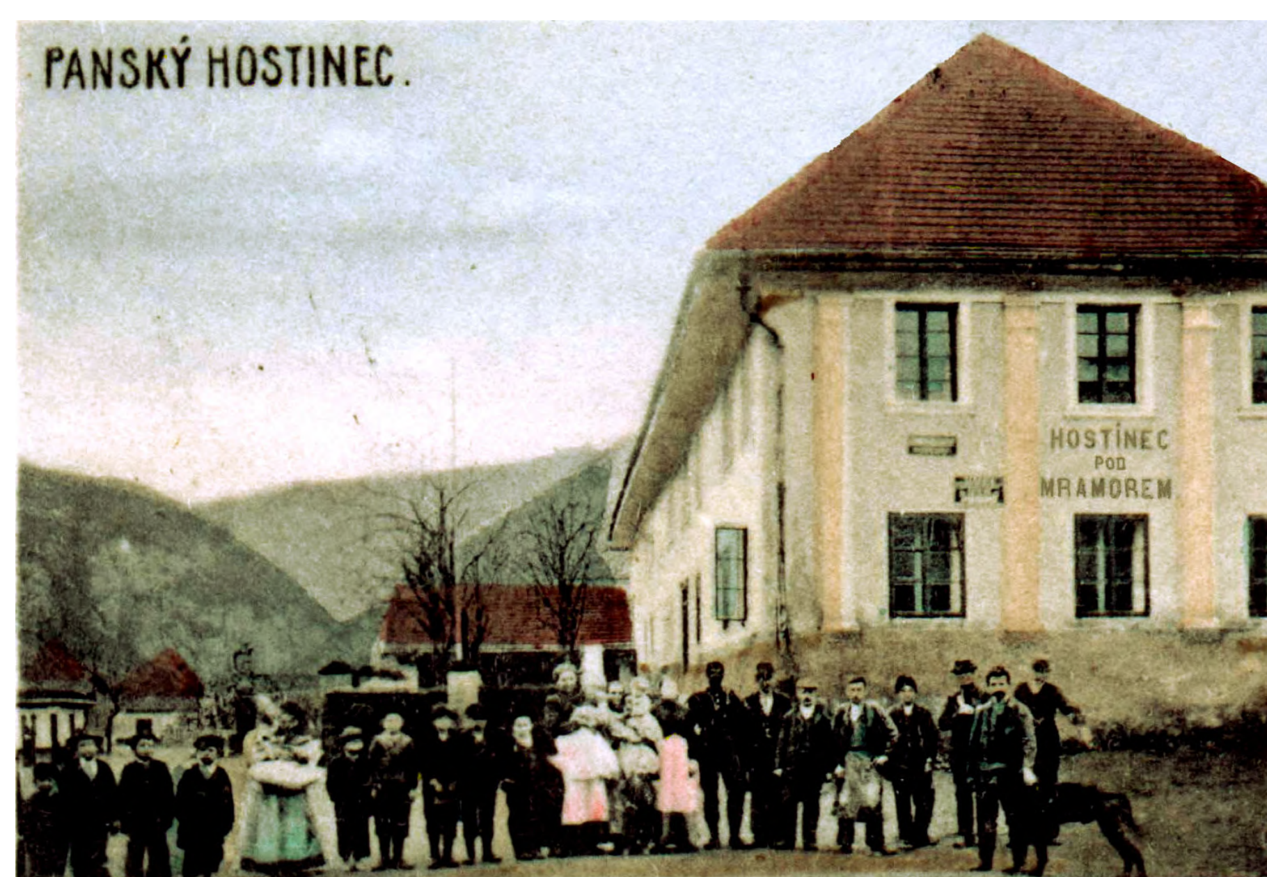
Podoba bývalého panského hostince na počátku 20. stol.

Budova Panského hostince je po objektu kláštera nejstarší budovou v obci. Má gotické základy a dochované renesanční a barokní prvky. Budova původně patřila ke klášternímu majetku a sloužila jako „Panský hostinec“ či „Hostinec pod Mramorem“. Ve 20. století sloužila část budovy jako fara a část jako obytné prostory či skladiště (původní fara fungovala od dob zrušení kláštera v části klášterní budovy). Od roku 2000 prochází historická budova zásadní rekonstrukcí. Nejprve zde bylo centrum environmentálních projektů pod názvem „Ekocentrum Kavyl“, v současnosti je zde Svatojánské infocentrum. V zadní části budovy se pořádají výstavy, další prostory slouží k bydlení, nebo jsou v rekonstrukci.