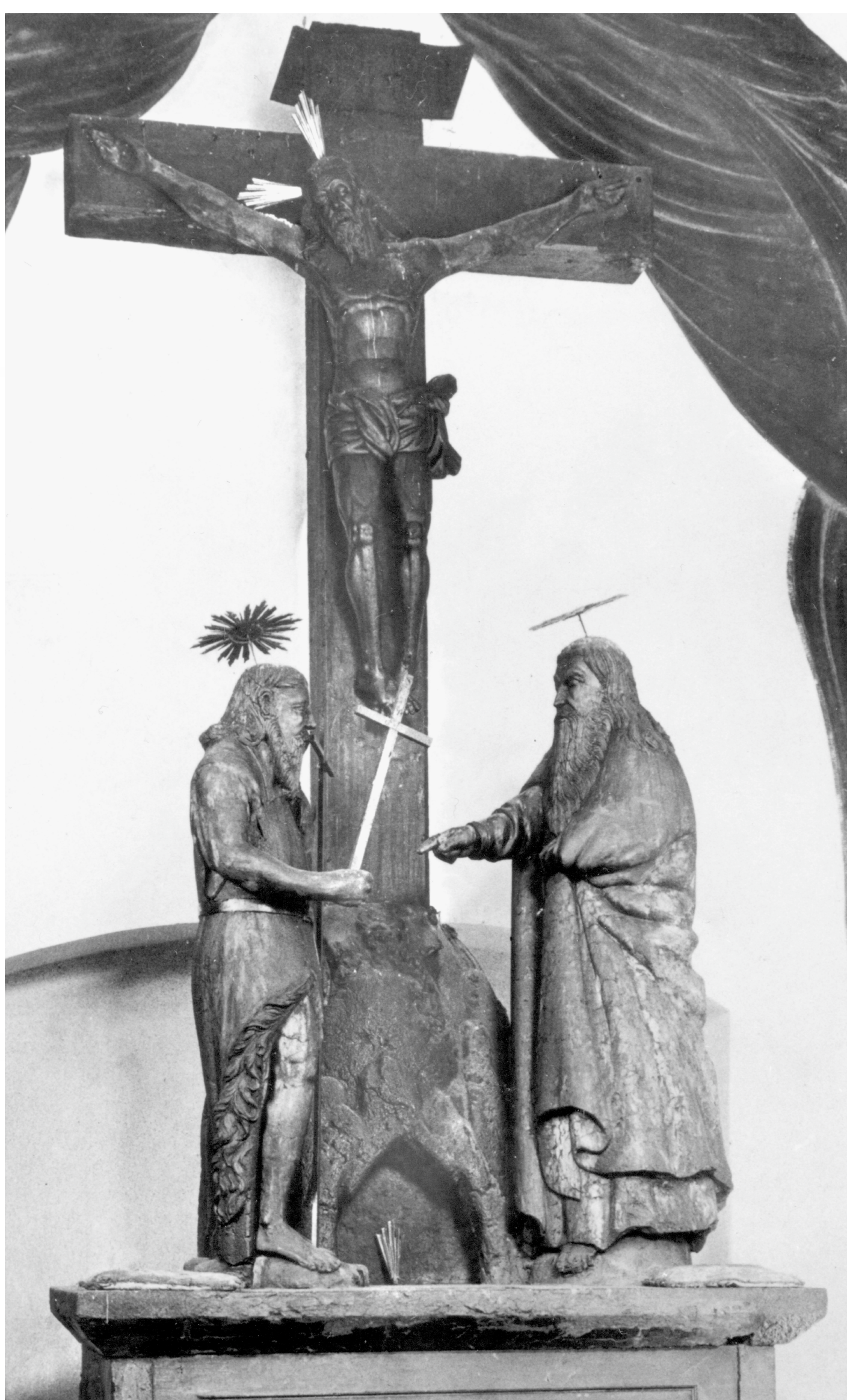
Původní podoba sousoší na fotografii z r. 1908.