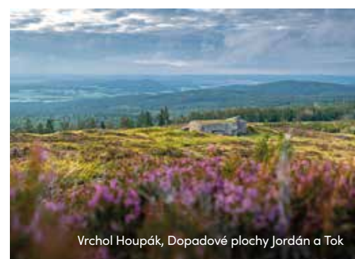
Vrchol Houpák, Dopadové plochy Jordán a Tok