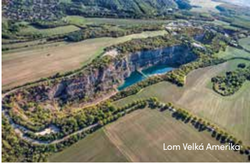
Lom Velká Amerika

Hledáte nenáročný výlet, který kombinuje historii i krásnou přírodu? Vydejte se na Karlštejn a k lomům Amerika. Auto nechte doma, celý okruh zvládnete díky vlakovému spojení pohodlně pěšky.