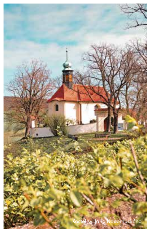
Kostel sv. Jana Nepomuckého